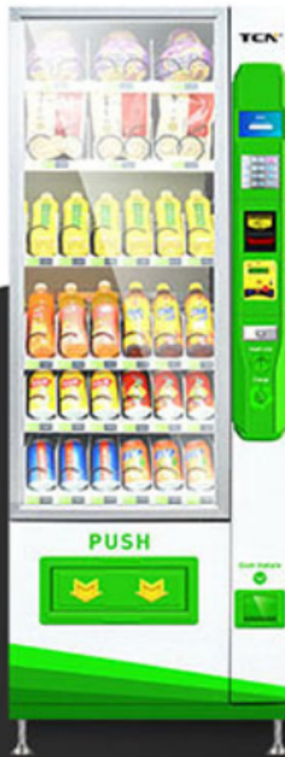
BEBIDAS Y SNACKS